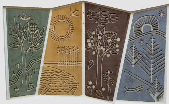
Kindergarten Hintere Strasse 85, Dettingen

Das vierteilige Sgraffito stellt die vier Jahreszeiten dar. Frühling, Sommer, Herbst und Winter.